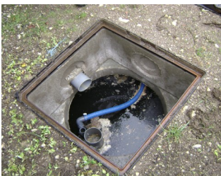
Partie 1 de la microstation : Le décanteur