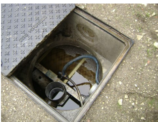
Partie 2 et 3 de la microstation: Le réacteur et le clarificateur

Notre envoyé spécial bactériologique est de retour de mission dans une microstation d'épuration et répond à nos questions: